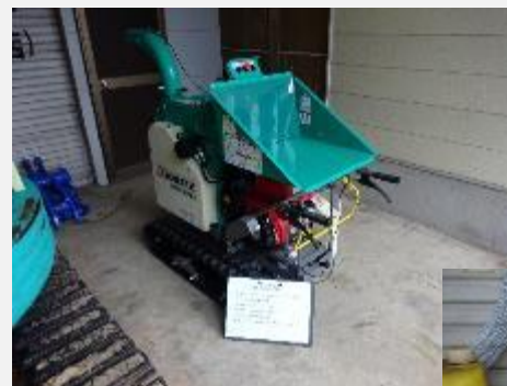
ウッドチップパー(古園)

耕作放棄地については、景観維持の意味でも、ほ場条件が悪い農地や道路から見渡せる農地を優先的に、ヒバや柚子などの作物に転換していく話し合いを進めている。