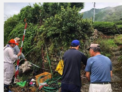
H30.8.30 広平地区現地検討状況