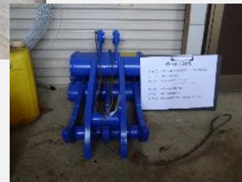
バックホーアタッチメント(古園)