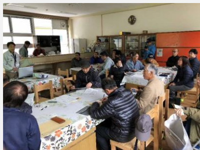
H30.3.1 岳間視察研修(ほっと岳間)