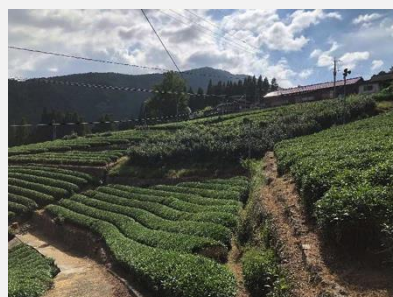
H30.8.27 野添地区現地検討状況