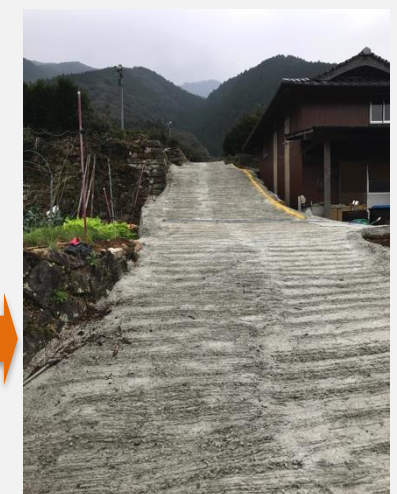
耕作道路整備後(広平)