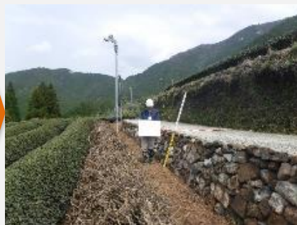
耕作道路整備後(広平)