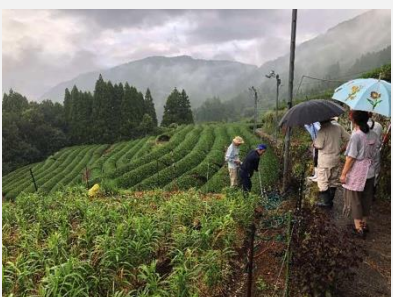
H30.8.30 広平地区現地検討状況