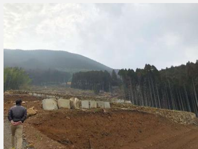
H30.3.1 岳間製茶圃場基盤整備状況視察