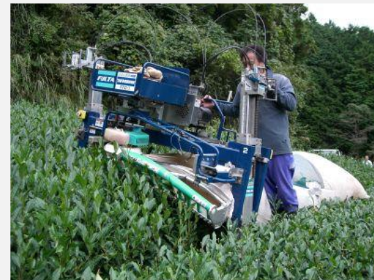
摘採機による茶の摘採作業

R3000の導入には、防霜ファンの完備が必須である。防霜ファンが整っていない茶園での導入は、霜にあたる確率が高くなるため、R3000の導入は施設が整っているところからスタートする。また、従来のかまぼこ形からR3000に成形すると、当面は収量が減少するため、成果は2、3年後となる予定。