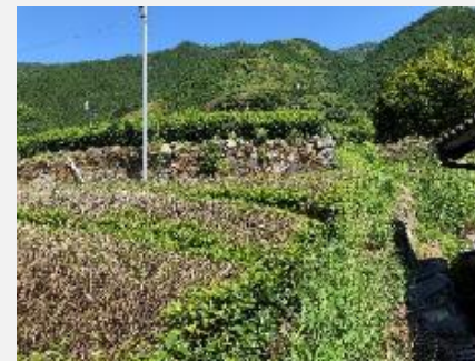
耕作道路整備前(広平)

広平地区の作業道を拡大整備。平成30年度は680m、令和元年度は50mを施工完了。野添地区も令和元年度までに70m施工する。