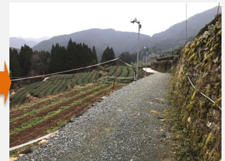
耕作道路整備後(広平)