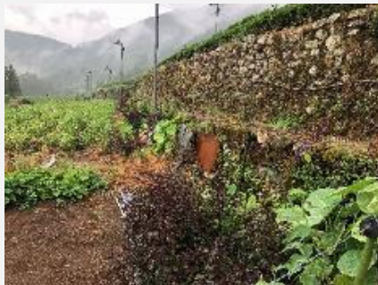
耕作道路整備前(広平)