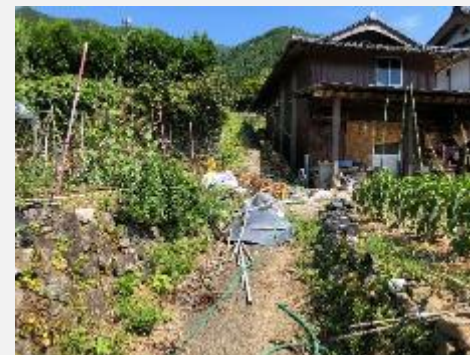
耕作道路整備前(広平)