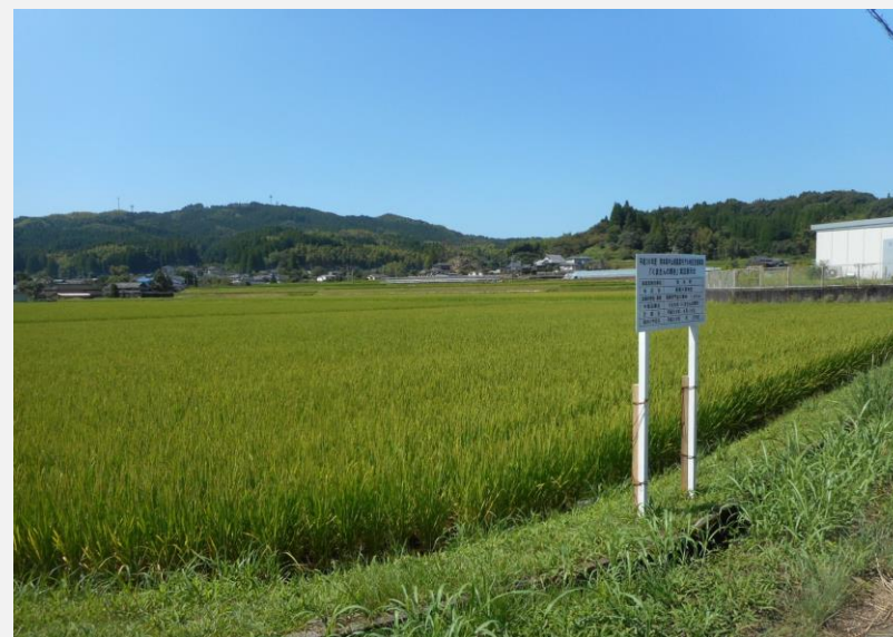
「くまさんの輝き」の実験栽培(15a)

本地区では、地元の子どもの持つ家族に向けて食農教育体験活動と題し栗やナスの収穫活動、採った食材を使って調理実習を行うことで生産者と子供たちの新しいコミュニティの形成を図っている。平成30年度から活動を始めて今年で2年目だが、参加者からは「家族の会話が増えた」「今後も積極的に参加したいという声が上がっており、今後も継続的に活動を行っていく見込みである。