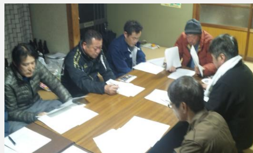
小原公民館での検討会

板楠小原集落営農組合の副組合長は和水町副町長が兼任。副町長は元々県職員で、農業政策にも携わった経験を持つ人物。話が上手で説明が分かりやすく、住民への説明もスムーズに行えた。