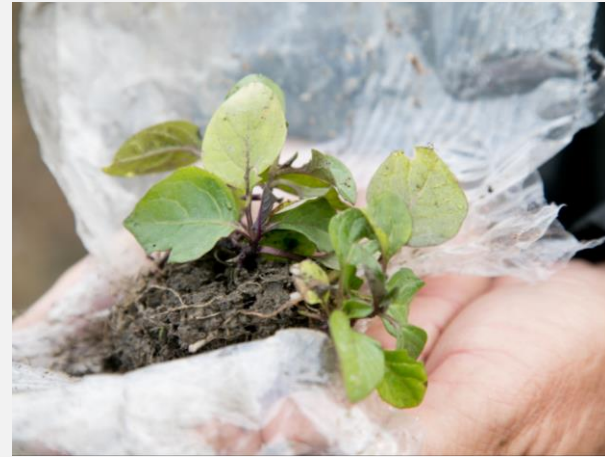
ホオズキの試験栽培