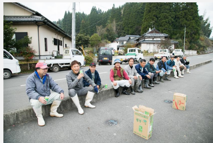
もともと人のつながりが強い板楠小原。 本事業の取り組みを通じて、さらに強いコミュニティへ。

山田錦はヒノヒカリより高単価だが収量が少ない。収益としては上がっていないながらも、“本物の地酒”というブランドづくりに寄与できた実績は大きい。今後も作付けを増やしていく予定。