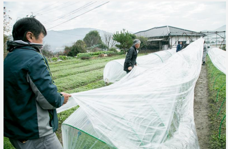
ホオズキの育苗ハウス