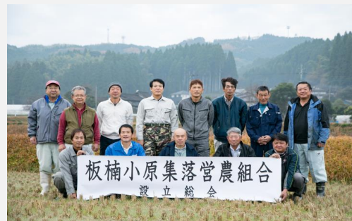
平成30年10月 板楠小原集落営農組合を設立

平成30年10月に、同志会のメンバー15名で「板楠小原集落営農組合」を設立した。中山間農業モデル地区支援事業の農業ビジョンについては平成28年度末に作成したステップアップ事業の農業ビジョンを参考にしながら、今後の活動がより行いやすくなるような内容で作成した。