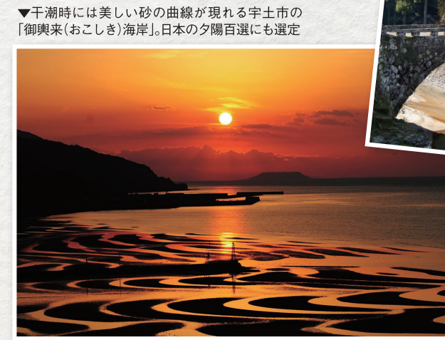
▼干潮時には美しい砂の曲線が見れる宇土市の「御輿来(おこしき)海岸」。日本の夕陽百選にも選定