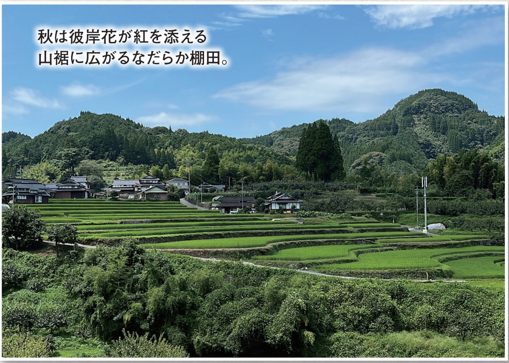
秋は彼岸花が紅を添える 山裾に広がるなだらかな棚田。

いう香りが特徴の「釜炒り茶」で有名です。また、山都町と美里町は、のどかな風景や古い町並を歩いて楽しむイギリス発祥の「フットバス」を九州でいち早く始めたエリア。多彩なフットバスコースを提案するほか、定期的にフットバスイベントも開催しています。