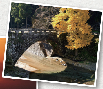
▲文政12(1829)年、美里町の清流・釈迦院川に架橋された「二俣(ふたまた)橋」

県央エリアには熊本市に隣接する宇城地域と上益城地域があります。宇土半島は、有明海沿いの宇土市と不知火海沿いの宇城市で構成されています。それぞれ魚介はもちろん、野菜やフルーツなど大地の恵みも豊かです。また、宇城市は洋ランなどの花き栽培も盛んです。九州山脈のほうに行くと、「雲台橋」をはじめとする石橋の里で知られる美里町や国指定重要文化財である「通潤橋」に出会える山都町など、里山の風景が楽しめる市町がたくさんあります。また、酒造りや化石発掘で知られる御船町などもあります。 上益城地域は、県内屈指のお茶の産地。特に山都町は「釜煮」と