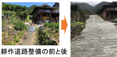
耕作道路整備の前と後