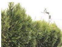
作付けされたヒバ(左)と柚子(右)