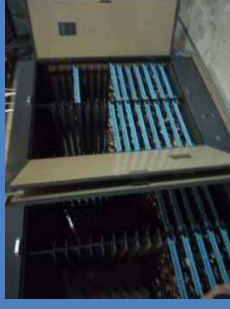
椎茸 (筍) 乾燥機