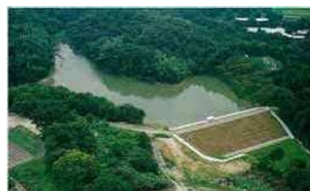
整備されたため池の全景