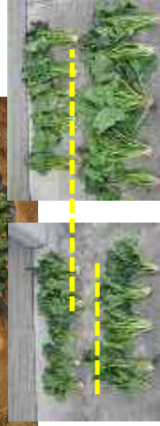
(事業の成果) 安定した用水の供給により、作付品種の拡大が図られている。