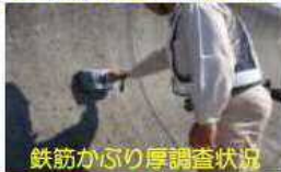
鉄筋かぶり厚調査状況