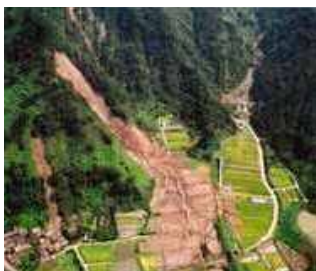
集中豪雨による特殊土地帯の災害

急傾斜地帯や侵食を受けやすい性状の特殊土地帯、又は風害等を受けやすい地域において、排水施設や防風施設等の整備を行うことにより、農用地の保全と災害の未然防止を図るとともに、優良農地を確保し農作物の生産性の向上に貢献します。