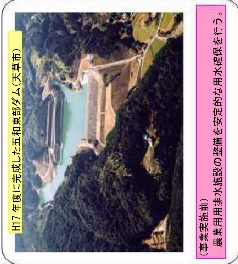
H17年度に完成した五和東部ダム（天草市）