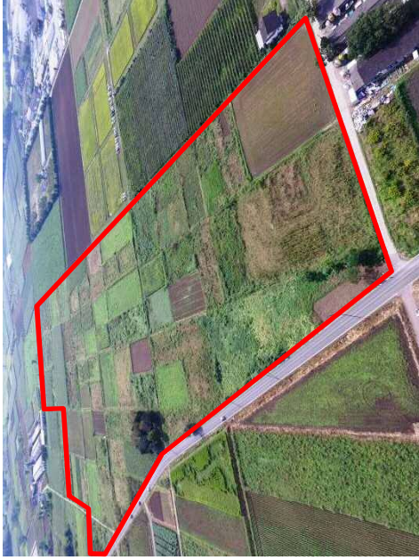
(事業実施前) 生産性が低く、耕作が放棄され荒れた農地(樹園地)