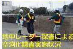
地中レーダー探査による空洞化調査実施状況