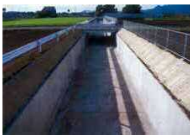
農地保全整備事業により整備された排水路