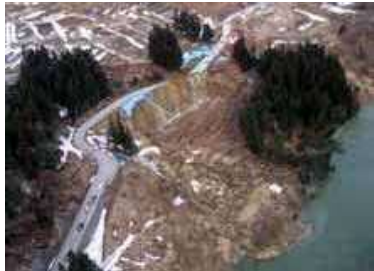
地すべりの発生及び地すべりのおそれ

地すべり防止区域内において地すべり対策を実施することにより、農用地・農業用施設をはじめ人家、人命及び公共用施設等の被害を防止し、国土の保全と安全で快適な生活環境の実現に貢献します。