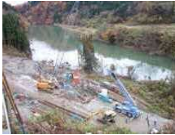
地すべり対策工事の実施