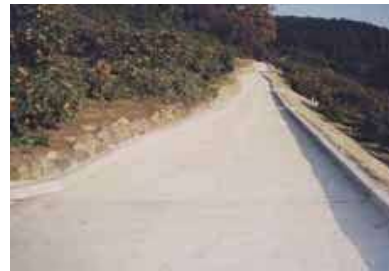
農地保全整備事業により整備された水兼農道