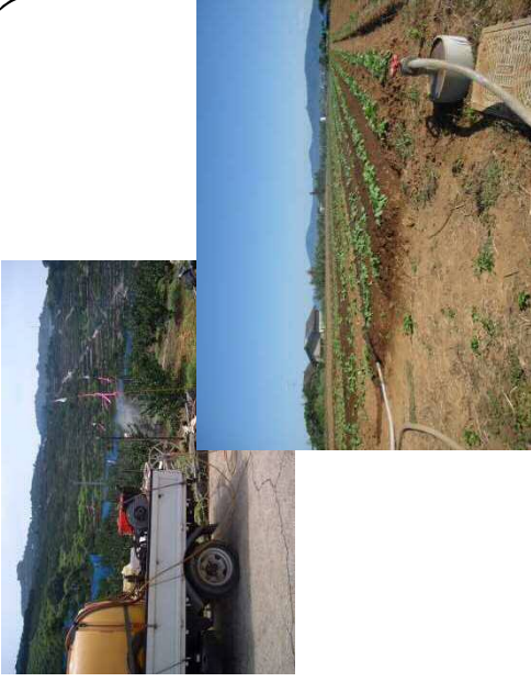
(事業実施) パイプラインによる農業用水の整備