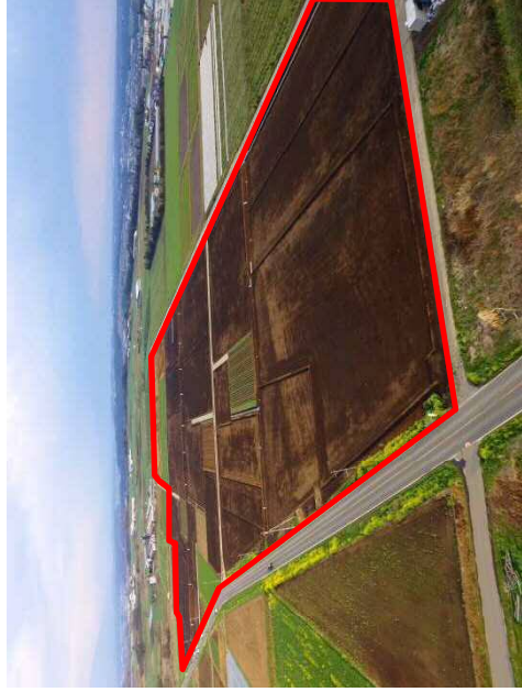
(事業の成果) 大区画で作業効率が良いと生産性の高い農地(樹園地)