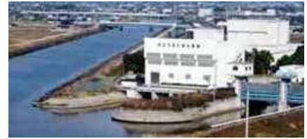
湛水防除事業により整備された排水機場