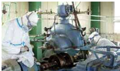
石綿が使用された機場における維持管理作業

施設の老朽化に伴う、石綿を含有する製品の破損等により、将来的に農業者等の健康を害するおそれが懸念されることから必要な対策を講ずることにより、石綿に起因する影響を未然に防止し、農業経営の安定及び農業の維持に貢献します。