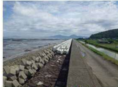
消波ブロック整備状況