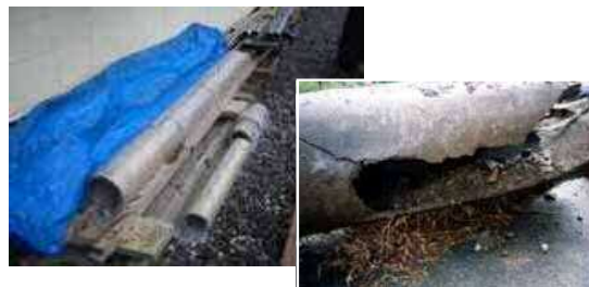
著しく老朽化し撤去された石綿セメント管