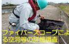
ファイバースコープによる空洞等の詳細調査