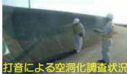
打音による空洞化調査状況