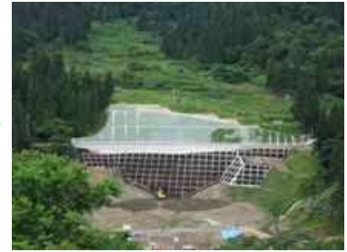
地すべり対策工事の完了