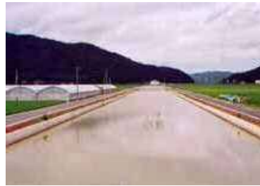
湛水防除事業により整備された排水路