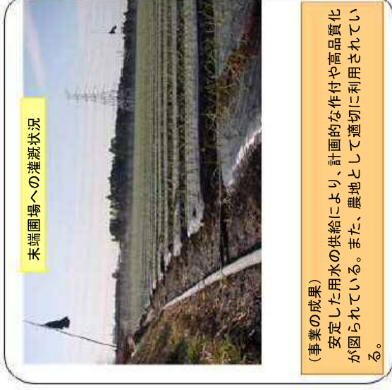
末端圃場への灌漑状況